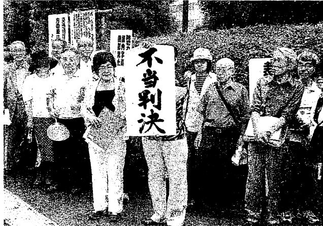
閉廷後に「不当判決」の垂れ幕を掲げる原告団ら—14日午前、さいたま地裁

について「利水・治水上の必要性はない」と主張。建設にかかわる事業費負担は違法と訴えていた。これに対し、遠山裁判長は判決で「利水上、水の安定的な供給のため余裕を持った需要予測を行うことは、不合理であるとはいえない」と指摘。治水効果については「200年に1回程度の確率で発生する降雨被害の甚大さを考慮すれば、効果がな」とは言えない」とした。国交省などによると、ダム