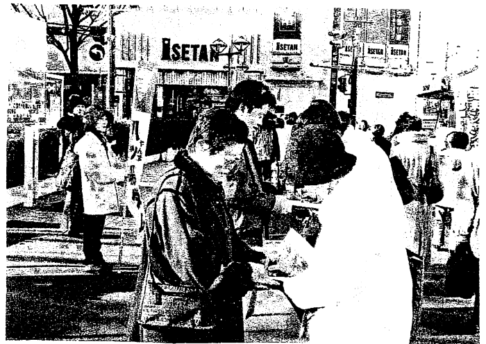
▲浦和駅西口にて署名活動

その他「首都圏のダム問題を考える市民と議員の会」や「1都5県の市民連絡会」、「全体弁護団会議」、「ハッ場あしたの会」の運営委員会に代表者が参加しています。