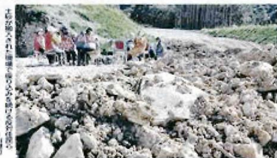
石木ダム付け替え道路工事現場