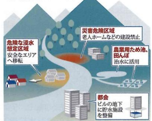
「流域治水」のイメージ図

る洪水で被害が激甚化。今こそ住民たちが土地の特性を知り、川と付き合っていくことが必要です。