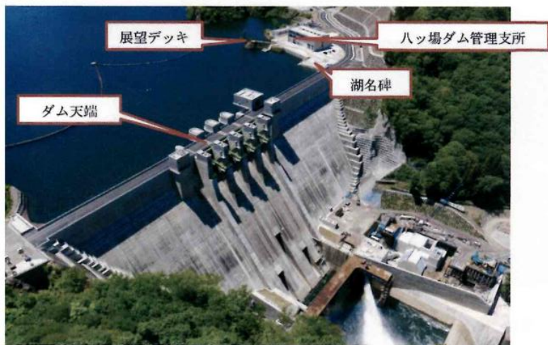
ハッ場ダム天端及び湖名碑（全景） 令和2年6月撮影