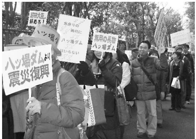
ハッ場ダム建設再開への抗議デモ 1/17